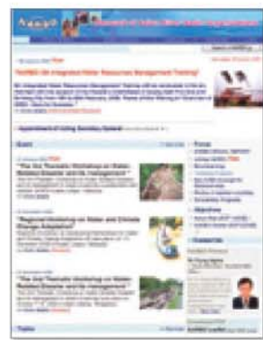
网页 ( http://www.narbo.jp/ )