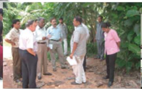
第2期培训(斯里兰卡)