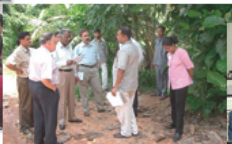
第2期培训 (斯里兰卡)