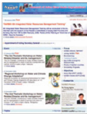
网页 ( http://www.narbo.jp/ )