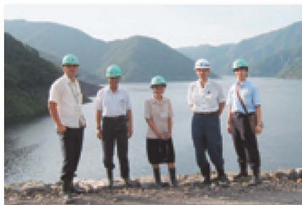
友好合作实地考察

促进成员间的友好合作,通过人员互访和会议交流,加强对各方经验的吸收以及优秀案例的理解。