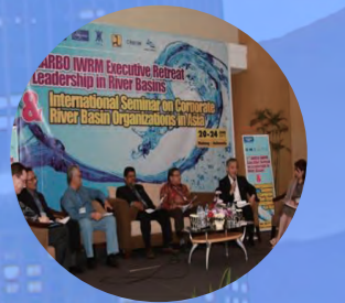
1st NARBO IWRM Executive Retreat on Leadership in River Basins (インドネシア)