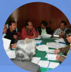
ベンチマーキング