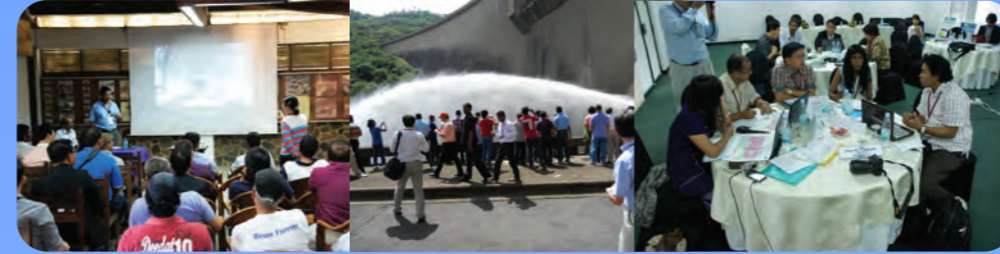
第7回IWRM研修(スリランカ)

ベトナムでの第5回研修以来、NARBOは2009年ユネスコが発表した河川流域レベルでのIWRMガイドラインを主な研修用テキストとして利用してきました。研修の成果はそれぞれの河川流域でのIWRM計画の確立に貢献してきました。